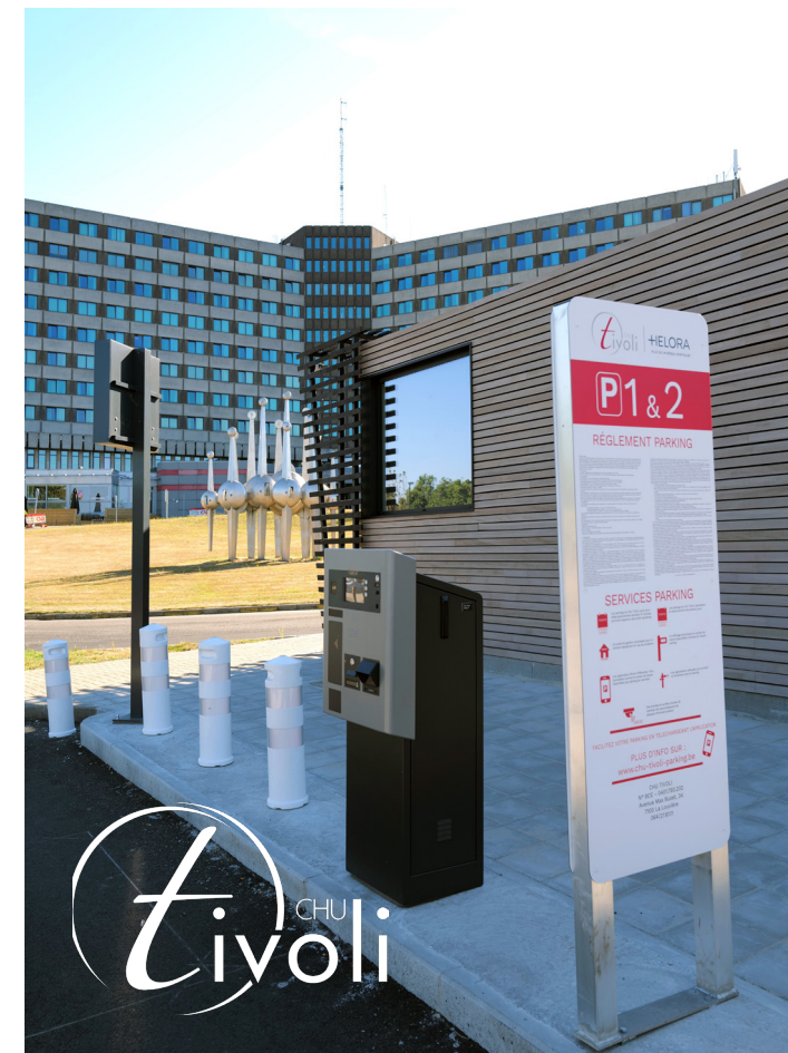
Mise à jour document 21-02-2024

NE PAS JETER SUR LA VOIE PUBLIQUE - METTRE A LA POUCELLE PAPIER